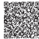
電子申請用二次元コード

里帰り出産などで埼玉県外に長期滞在する場合など、埼玉県内の委託医療機関以外で接種を希望する場合は、償還払いにより接種費用を助成する制度があります。以下の手順に従い、 必ず予防接種を行う前に上尾市が交付する「予防接種依頼書」を用意してください。 (事前に依頼書の交付がないと、接種費用の助成の対象になりません。)