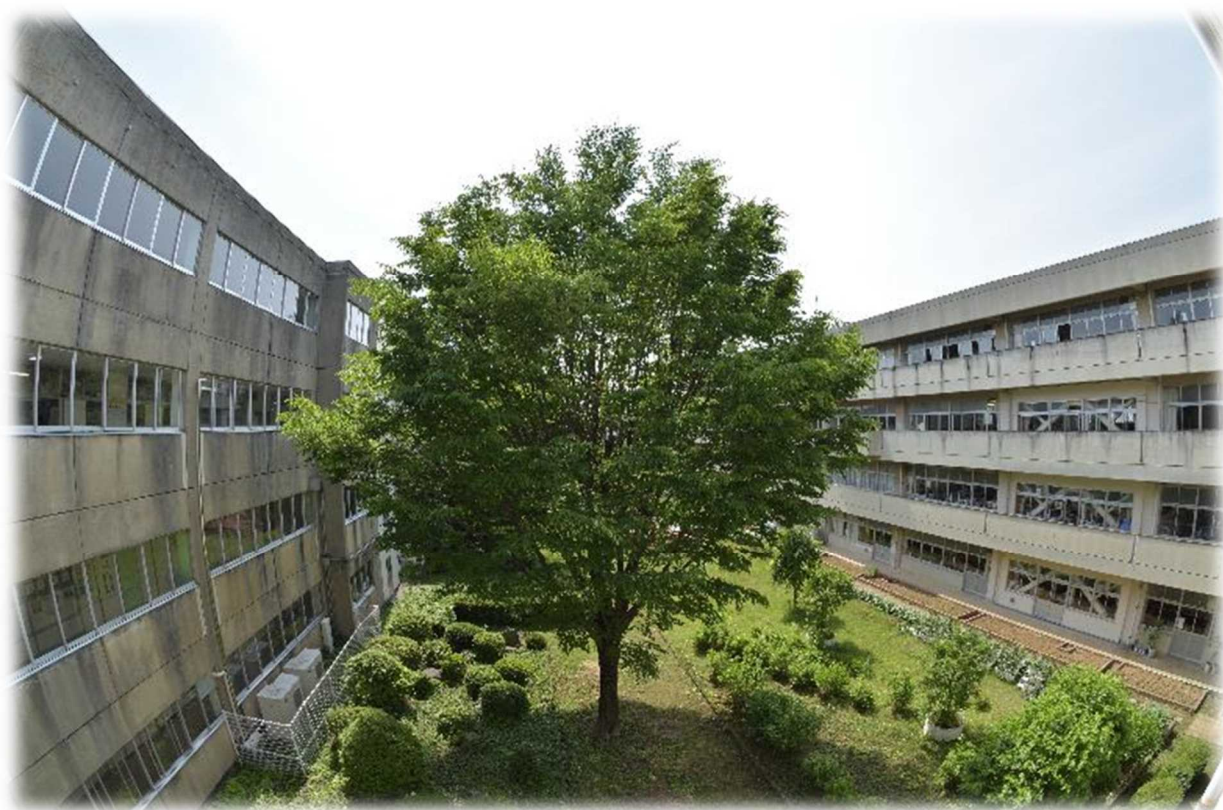
（大石南中学校 中庭のけやき）