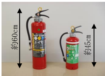
20型消火器(左) 10型消火器(右)