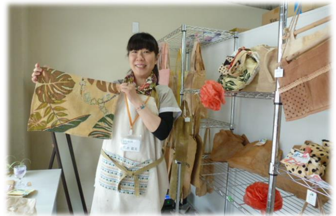
【商品を紹介するスタッフさん】

※就労移行支援事業、就労継続支援 B 型事業とも対象になる方には条件がありますので事前にご確認ください。