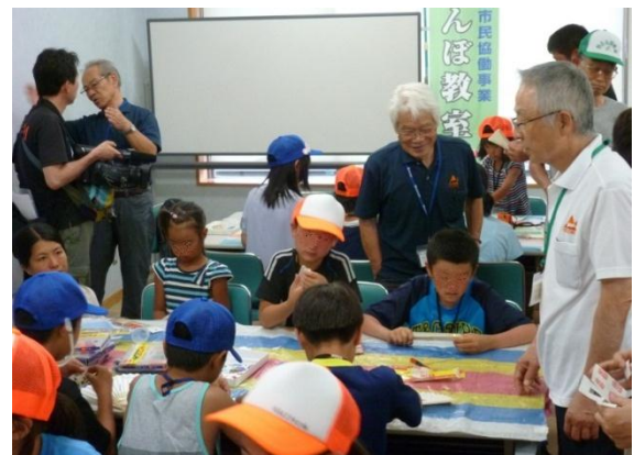
【竹とんぼ作りに夢中の子どもたち】

竹とんぼクラブは8月1日(土)こどもの城で、北海道の幕別町と上尾市との間で41年間続いている「子ども交歓会」に参加した子どもたちを対象に「竹とんぼ教室」を開きました。自分で作った竹とんぼを広場に出て飛ばしてみた子どもたちは、高く軽やかに舞い上がる竹とんぼに目を輝かせ、歓声を上げていました。