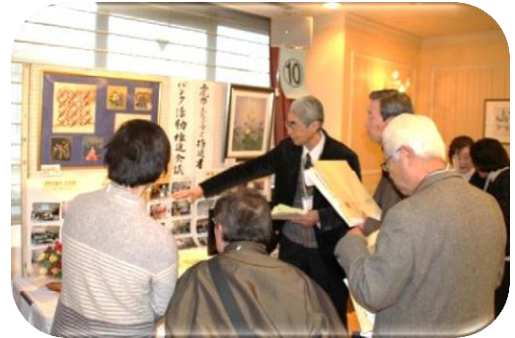
【平成26年度の展示風景】

日 時：平成28年2月6日(土)午後1時～4時30分 場 所：東武バンケットホール上尾「フローラ」の間 定 員：50名 参加費：500円(ケーキと飲み物付)