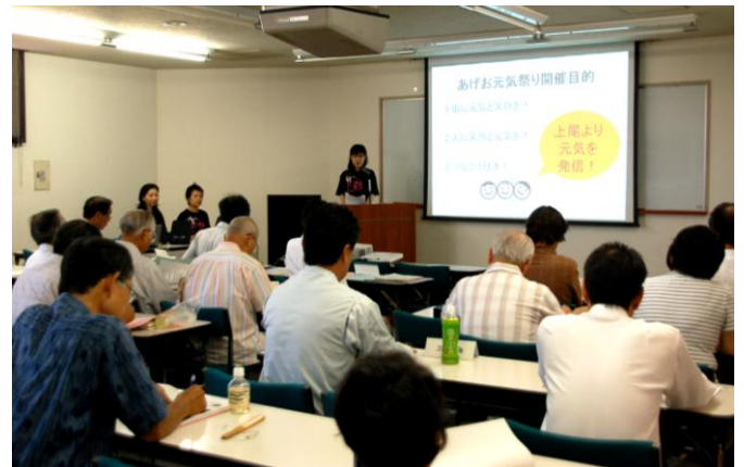
【提案事業を説明する発表者＝市コミュニティセンターで】

採択された3団体は7月から来年2月までの間、事業を実施し、3月に事業報告会を予定しています。